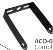
ACO-002 Complemento para montaje en muro. Se vende por separado.