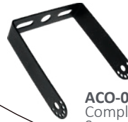
ACO-002 Complemento para montaje en muro. Se vende por separado.